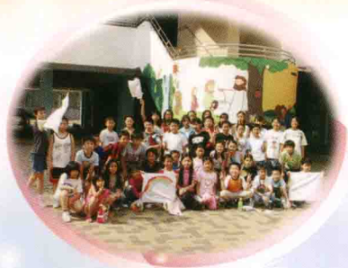
風紀隊參與「校園領袖訓練營」時留影。

為建立全校綱紀，教導學生遵守校規，培養純樸的校風及學生優良的品格和自律精神，訓輔組於本年度除了定期舉辦「早禱時段」及「公民訓練課」、「家長學生講座」及「防火演習」，同時亦舉辦了多項訓輔活動，包括「校本輔導活動」、「成長的天空」、「成長課」、「關懷大使」、「『寫』意天地」、「伴讀天使」、「赤子情」、「交齊功課獎勵計劃」、「禮貌大使獎勵計劃」、「班際秩序比賽」、「『基德是我家』活動日」等。