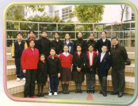
於將軍澳校舍招募的團員與關校長、黃老師合照。

我們的團員在下學期還會參加各類型的比賽或活動，有關精采過程，將於下一期校訊為大家報導。