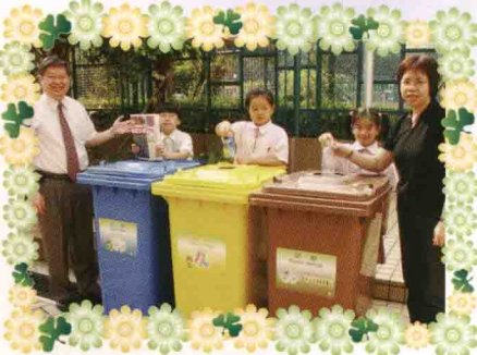
我們添置的三色分類回收桶正式啟用了！

老師指導下，協助打理校園耕地，學習各種基本農務，採用有機肥料如花生麩、骨粉等；又利用光碟底面反光的特性，把棄用的光碟成串掛在田邊迎風飄揚，以驅趕雀鳥；他們每天早上上課前及下午放學後都勤於在耕地上澆水。相信在老師及同學的努力下，數月後這片耕地將結出豐碩的蔬果！