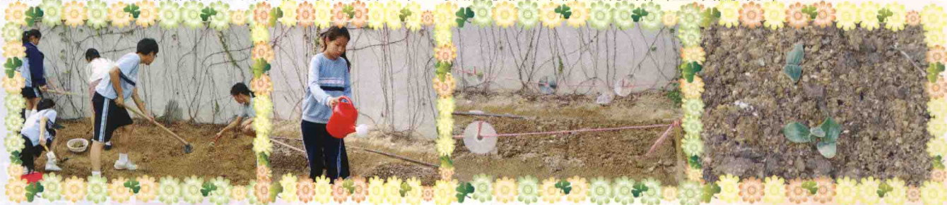
同學們正在開展有機耕種的第一步——翻土。