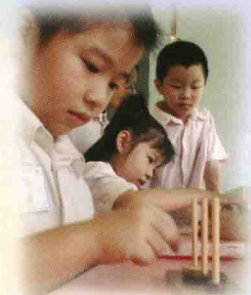
全力以赴，做到最好！

每年，數學科均會舉辦及參與多元化的學習活動，其中包括「數學同樂日」、「速算比賽」、「校內數學比賽」、「數學遊蹤」、「奧林匹克數學」培訓及比賽、「數學探險之旅（每日30）」、「智力挑戰」等等。目的旨在引起學生對學習數學的興趣，提升學生理解及掌握數學的基本概念和計算技巧，以及發展學生的思維、傳意、解難及創造能力。