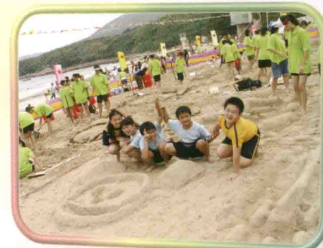
團員參與「西貢區堆沙大賽暨堆沙交流活動2005」。