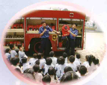
寶林消防局隊員到校舉辦講座及介紹消防車設備。

另一方面，訓輔組亦為風紀隊舉辦領袖訓練活動，藉以發展風紀隊員的領導才能，提升他們自律、自治及待人處事的能力，同時也讓他們參與維持校內紀律的工作，使他們成為其他同學的良好榜樣。