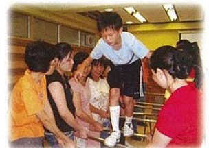
在你們的鼓勵下，我勇敢地前進