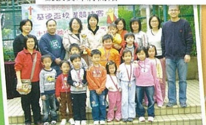
一年級基德隊實力雄厚