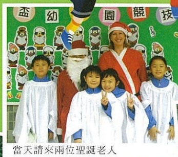
當天請來兩位聖誕老人