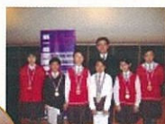
評判與獲獎同學合照