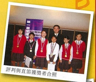
評判與直笛獲獎者合照