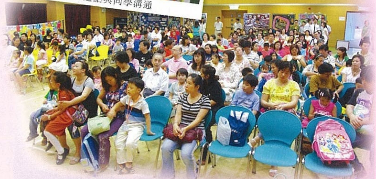
迎新及成果展示日，學生及家長濟濟一堂