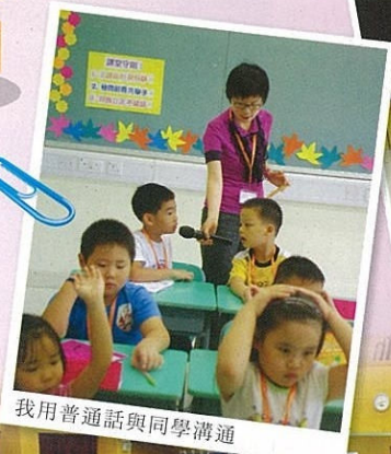
我用普通話與同學溝通