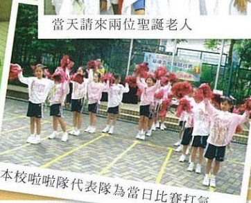
本校啦啦隊代表隊為當日比賽打氣