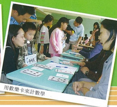
用歡樂卡來計數學