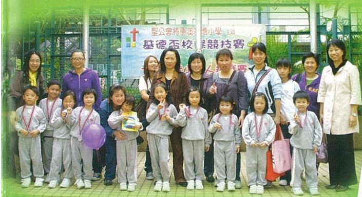
宣道幼稚園校長、師生大合照