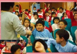
師生齊閱讀三十分鐘