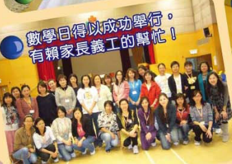
數學日得以成功舉行，有賴家長義工的幫忙！