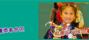
校際乒乓球比賽冠軍西貢區