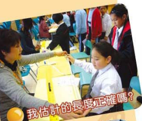
我估計的長度正確嗎？