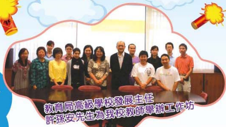
教育局高級學校發展主任許潔安先生為我教師舉辦工作坊

每年中、普兩組均合辦中普周，讓學生透過主題學習，對中國文化有更深入的認識，活動包括：展板欣賞、攤位遊戲、故事演講比賽、粵普對譯遊戲和電影欣賞等，節目豐富。學生寓玩於學，樂在其中。