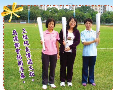
三位校長傳遞火炬，為運動會揭開序幕。

我們三位校長負責傳遞最後一棒。當她們手持火炬，經過觀眾席的一刻，師生們均報以熱烈的掌聲，為這個「不一樣」的運動會推上高潮。