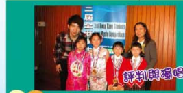
評判與導師獲獎者合照