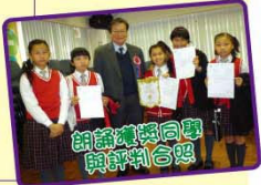
朗誦及音樂推廣協會