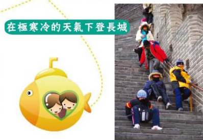
在極寒冷的天氣下登長城