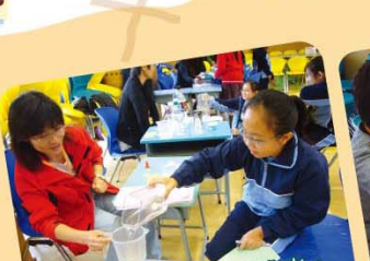
我倒了約六百毫升水。

為了鞏固學生的課堂學習及生活應用，本科於各級增設體驗活動，如五年級學生於旅行日時進行與方向有關的測量活動，一面活動，一面遊戲，效果理想。另外，為了讓學生跳出課堂的框框，安排二年級學生在家長和學長的協助下，到超市進行買賣活動，讓學生學習正確使用貨幣；又透過買賣活動，讓學生一方面學習如何使用貨幣，一方面學會關愛別人，實是難得的機會！