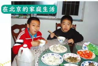
在北京的家庭生活