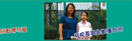
校長與傑出同學合照